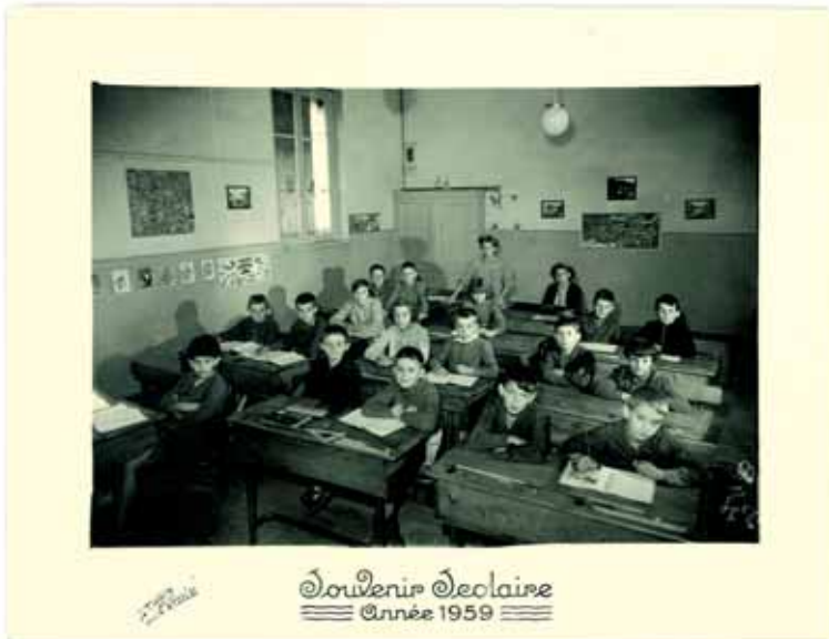
Photo dans la classe en 1959