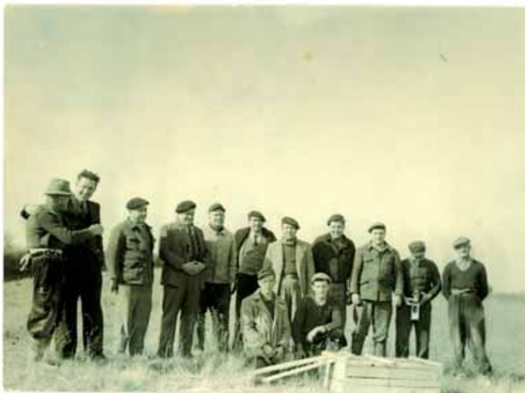
Photo de chasse