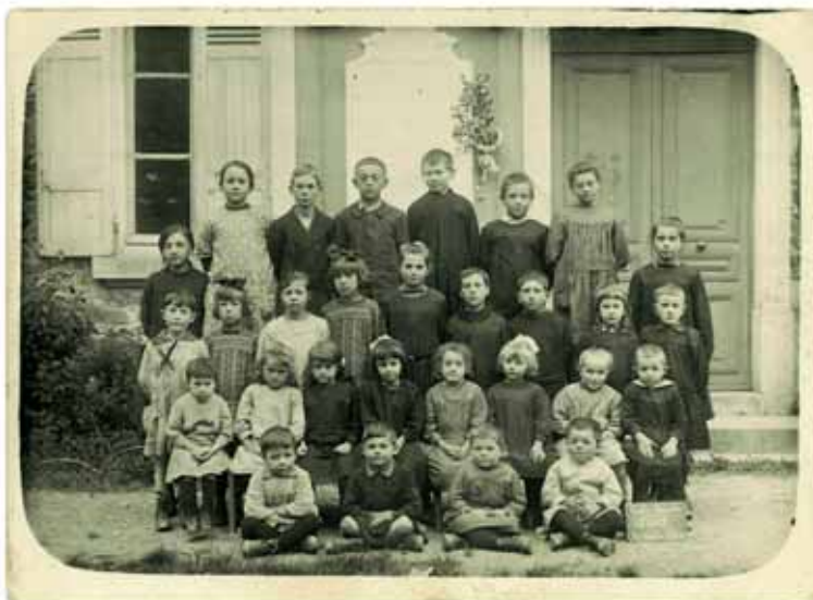
Photo de classe extérieur de 1925